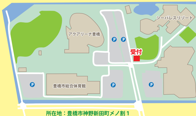
豊橋総合スポーツ公園 MAP

※参加登録をした方先着 600 名様に参加記念品をプレゼントいたします。 ※ゴミ袋、軍手は用意します。作業のできる服装でご参加下さい。